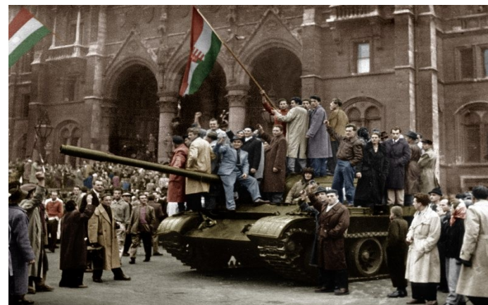
Az 1956-os forradalom 55-ik évfordulója